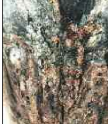
कीट प्रभावित साल का पेड़।