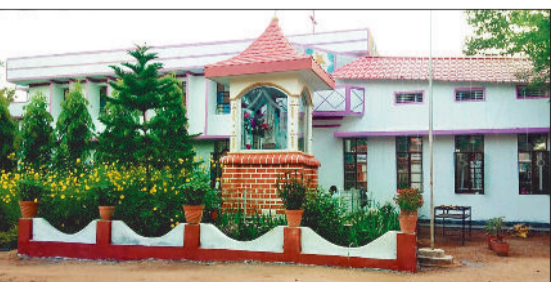
क्रिसमस के लिए सजा चर्च।

जानकारी के अनुसार आज आरसी चर्च रामपुर में 24 दिसंबर को क्रिसमस का पर्व मनाने के लिए समाज के लोग बड़ी संख्या में रात्रि में जुटेंगे। जहां मध्य रात्रि