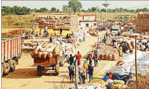
धान खरीदी केंद्र में अपनी उपज बेचने पहुंचे किसान।

कोरिया में 22 उपार्जन केन्द्र बनाए गए थे। इनमें गिरजापुर, चिरमी, जामपाया, झरनापाया, छिंदिया तरगाव धौराटिकरा, पटना, पोड़ी, बैमा, बड़ेकलुआ, रजौली, सरभोका, कटगोड़ी, सलबा और