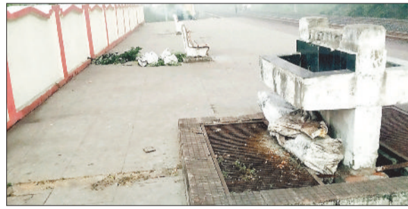
स्टेशन पर छिपाकर रखा गया कोयला।

जानकारी के अनुसार रोजाना शाम 5 बजे के पश्चात देर रात्रि तक एवं सुबह 4:30 से 7 बजे तक थाने के सामने नेशनल हाईवे में कोयला चोर साइकिल, मोटरसाइकिल एवं पिकअप में बोरियों में कोयला लदा कर तेजी से ले जाते हुए नजर आते हैं। एक बोरे में औसतन 80-90 किलो कोयला रहता है, कोयला चोर प्रतिदिन सुबह 5 बजे के लगभग चरचा छठघाट डी प्वाइंट की ओर से चरचा थाने के आगे हाईवे पर जाते नजर आते हैं। साथ ही बड़े-बड़े लोहा कबाड़ चौरों के द्वारा बैकुंठपुर रोड रेलवे स्टेशन से जबलपुर एक्सप्रेस में भेजा जा रहा है। शुक्रवार की सुबह बैकुंठपुर रोड रेलवे स्टेशन में करीब डेढ़ पिकप के लगभग हजारों रुपए के नया पुराना रोला साफ्ट एवं अन्य कई कबाड़ जबलपुर ट्रेन से ले जाने की फिराक से चौरों द्वारा छुपा कर रखा था। इसकी जानकारी मिलने पर