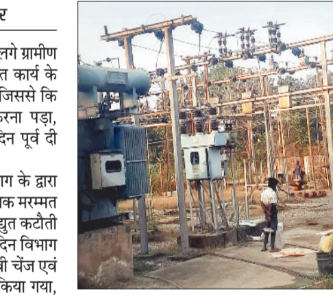
जानकारी के अनुसार विद्युत कटौती से बैकुंठपुर सब स्टेशन से निकलने वाले समस्त 11 केव्ही

जानकारी के अनुसार विद्युत विभाग के द्वारा शनिवार को सुबह 9 से दोपहर 1 बजे तक मरम्मत कार्य संपादित किए जाने के कारण विद्युत कटौती किए जाने की सूचना दी गई थी। इस दिन विभाग के द्वारा बैकुंठपुर सब स्टेशन में वीसीबी चेंज एवं उप केन्द्रों में आवश्यक सुधार कार्य किया गया, इसके चलते शनिवार को शहर सहित शहर से लगे ग्रामीण क्षेत्रों में विद्युत आपूर्ति बाधित रही।