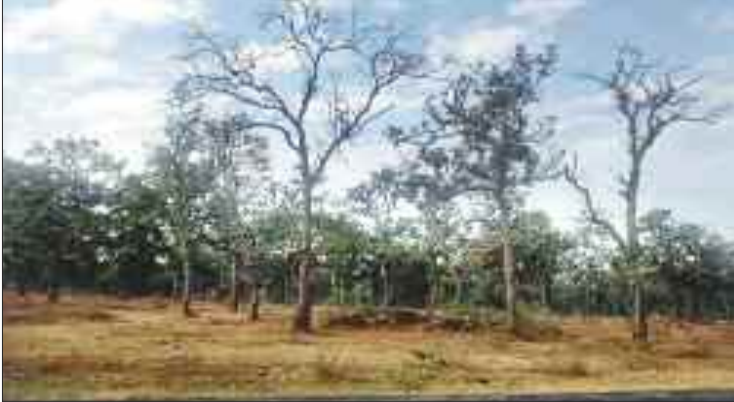
जंगल में सूखे साल के पेड़।

छत्तीसगढ़ के शिमला की पहचान वहां के साल जंगल, प्राकृतिक नदियां, झरने एवं पहाड़ है। साल वनों के कारण प्रकृति ने मैनापाट को विशेष वातावरण दिया है। इन वनों के कारण ही यहां का तापमान नियंत्रित रहता है। पिछले कुछ सालों से वनों में मानवीय दखल बढ़ने के कारण तेजी से पेड़ों का क्षरण हुआ है। वनभूमि पर कब्जा जमाने के लिए ग्रामीण योजना बढ़ तरीके पेड़ों को सूखते देख वन अमले इसे गंभीरता से नहीं लिया। धीरे-धीरे कीट प्रकोप बढ़ने लगा तो वनकर्मियों ने इस पर ध्यान दिया। अब कीट का प्रकोप जंगल के बड़े क्षेत्र में फैल गया है जिससे साल के पेड़ तेजी से सूख रहे हैं। जानकारों का कहना है कि साल बोरेर नामक कीट साल वृक्ष के रस को पसंद करता है। वह हरे पेड़ों में छेद कर घुस जाता है। पेड़ में जगह-जगह काफी लंबा सुराख कर देता है। एक साथ कई कीटों के