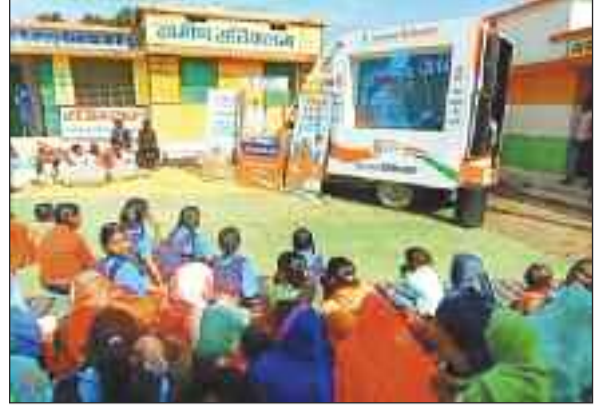
आयोजित कार्यक्रम में उपस्थित हितग्राही।