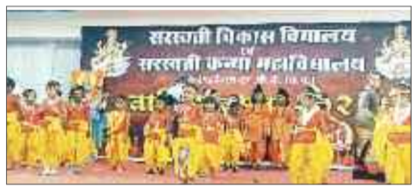
सरस्वती विकास विद्यालय के वार्षिकोत्सव में प्रस्तुति देते बच्चे।