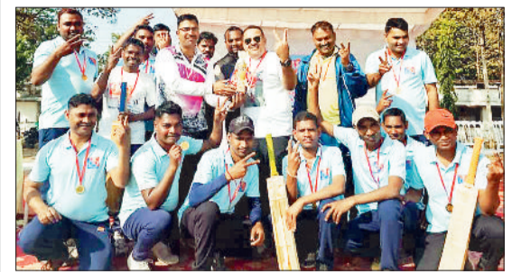
ट्राफी के साथ सूरजपुर की विजेता टीम।